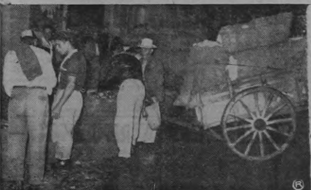
DESCARGANDO PRODUCTOS EN EL MERCADO: —La gráfica de Solano muestra el trajín mañanero en el momento que los productores descargan sus artículos en el mercado.

Hay por ello gran esperanza en los mercados de verduras y legumbres y frutas que se ha anunciado serán abiertos en Plaza González Víquez, y otros lugares. Allí el Consejo de Producción venderá directamente al público esos productos. Y al mismo tiempo, el productor se sentirá garantizado, no tendrá que andar en te sus naranjas, sus chayotes, sus lechugas o repollos, sino que esta angustias vendiendo rápidamente seguro de que el Consejo, o el organismo que lo sustituya, le comprará toda su producción a un precio fijado de antemano.