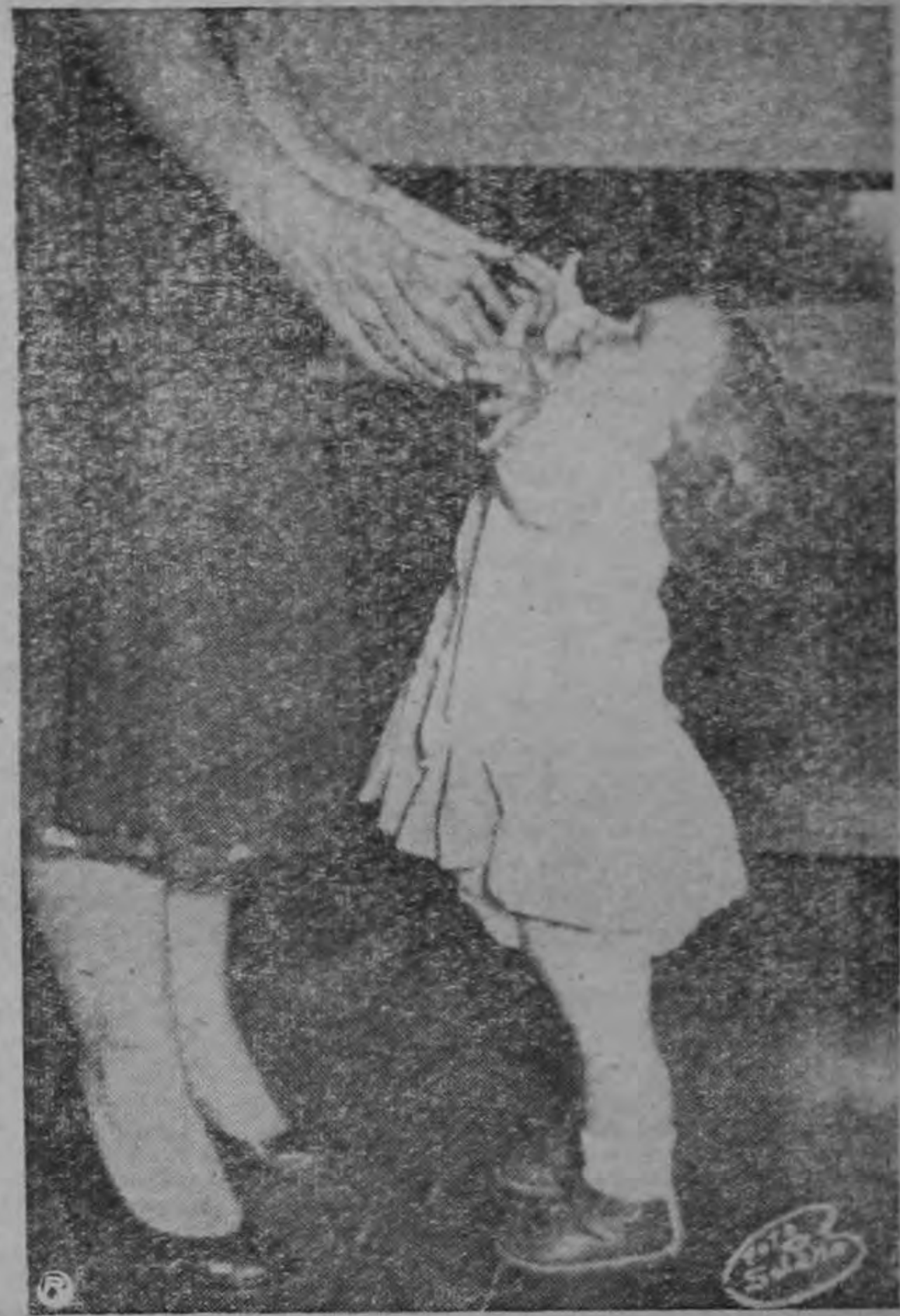
PROTECCION MATERNA. —El niño siente que su seguridad reside en el abrazo materno.

Se acordó también, que va ha llegado la hora de constituirse en un fuerte bloque, para informar a la opinión pública de la actividad llevada a cabo por el Colegio de Ingenieros Agrónomos en la defensa de sus más elementales principios de ética profesional y de los derechos no reconocidos que le asisten.