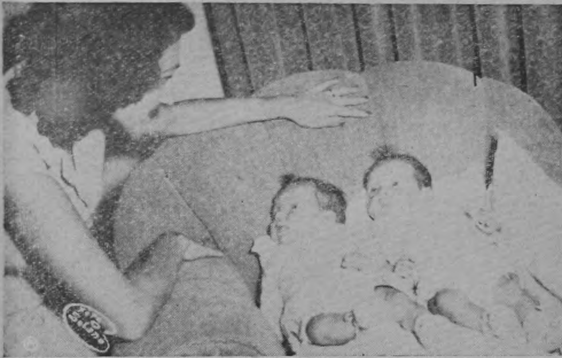
PRESENCIA DE LA MADRE. —La placidez condecorando el rostro, que la presencia de la madre auspicia.