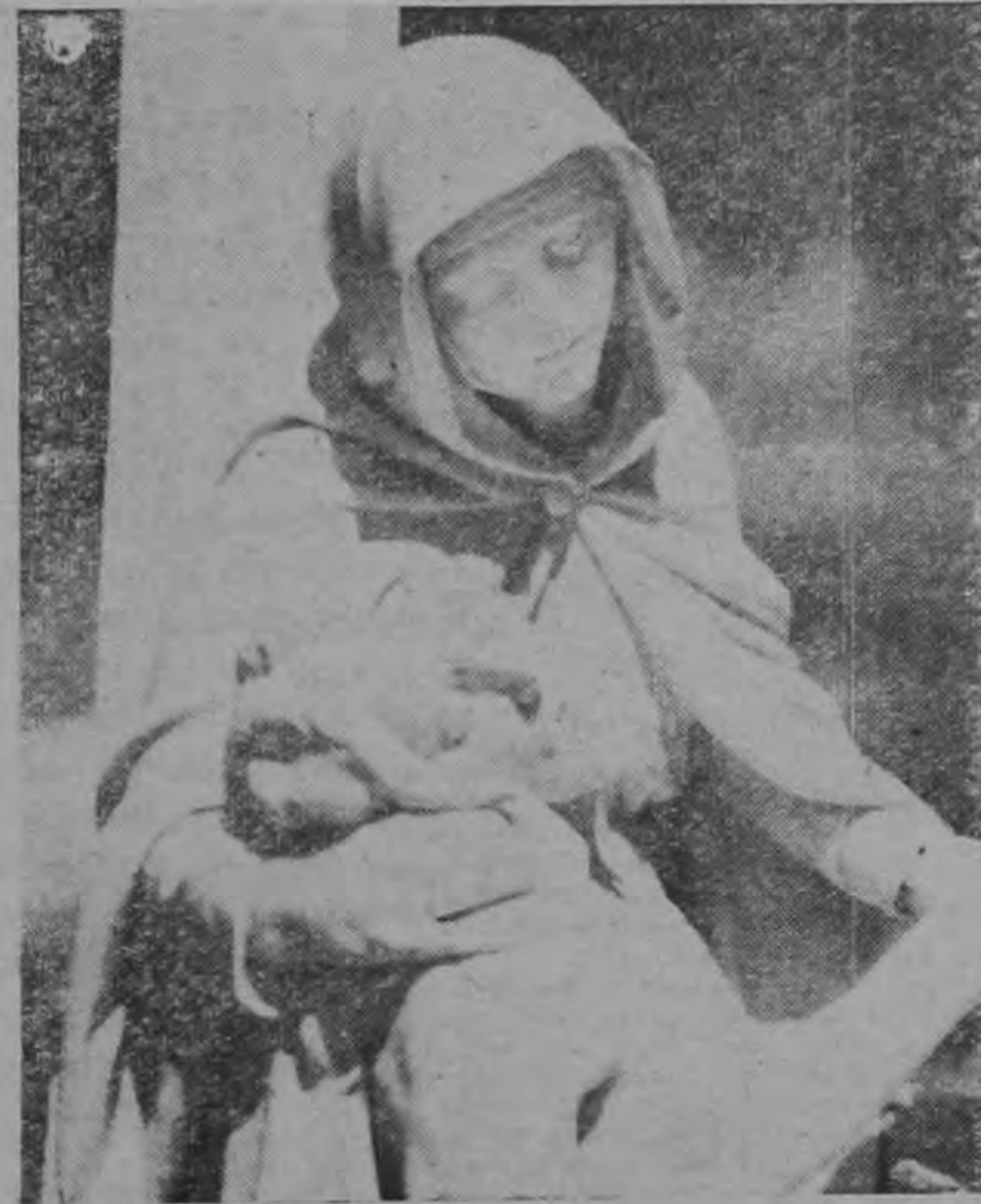
Ilustrado en esta página con un recuerdo lleno de emoción a la procreadora eterna de generaciones.