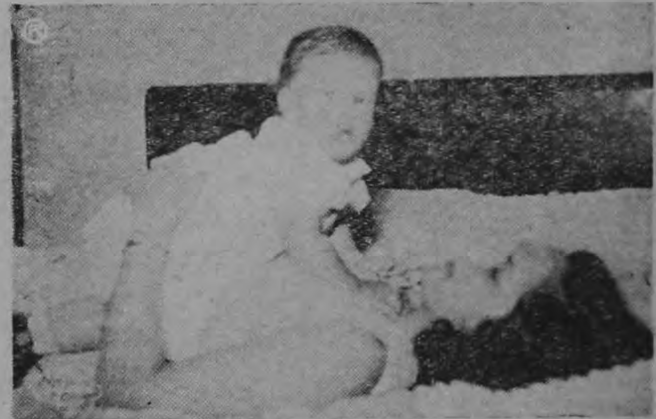
UN ANGEL LO SOSTIENE. —Desde la infancia a la vejez, el hombre es sostenido por la presencia eterna de la Madre.