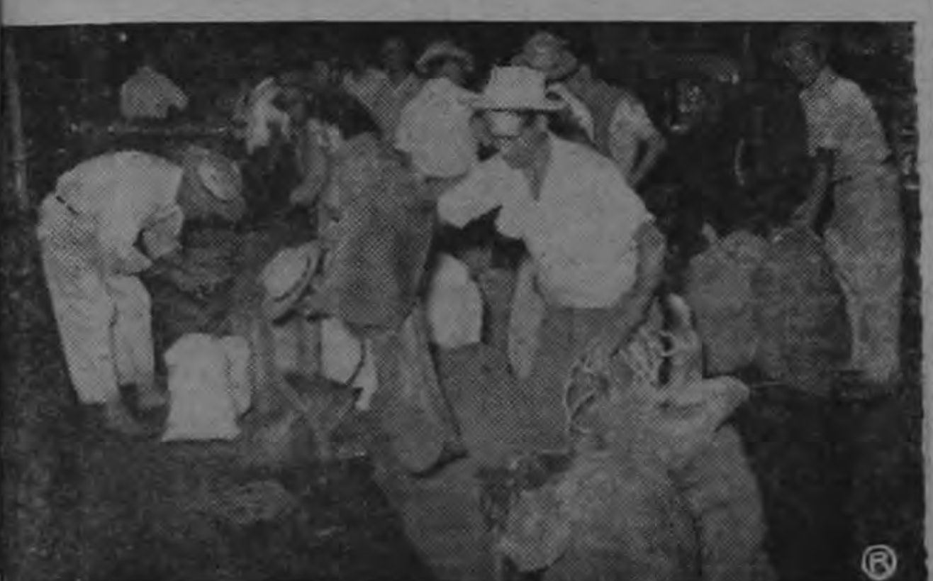
MERCADEO DE PRODUCTOS: —Productores e intermediarios en el momento de tratar los productos acabados de llegar de las fincas.