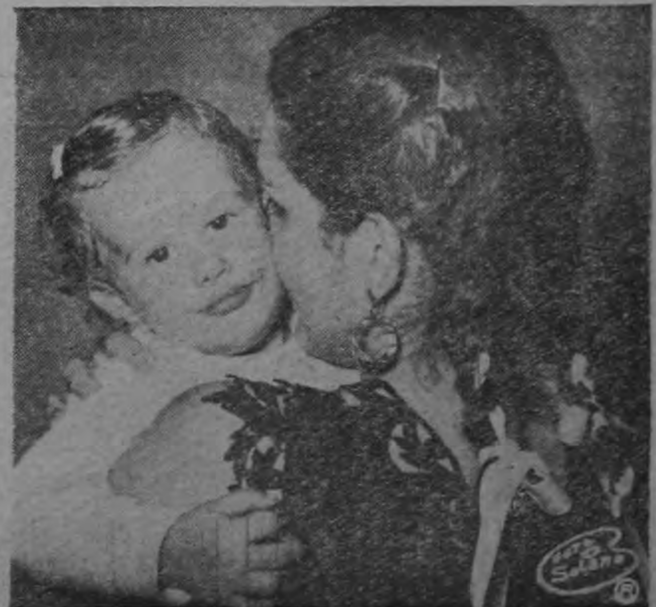
EL ABRAZO MATERNO. —El niño es sostenido entre los brazos amorosos y tiernos de la madre, escudo protector de su simiente.