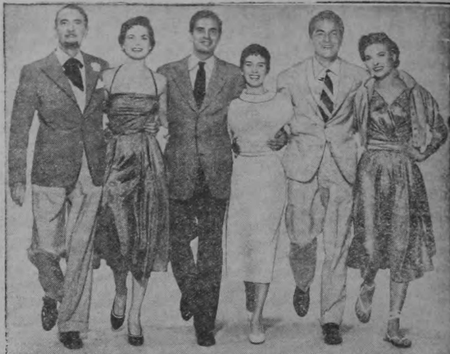
COINS IN FOUNTAIN