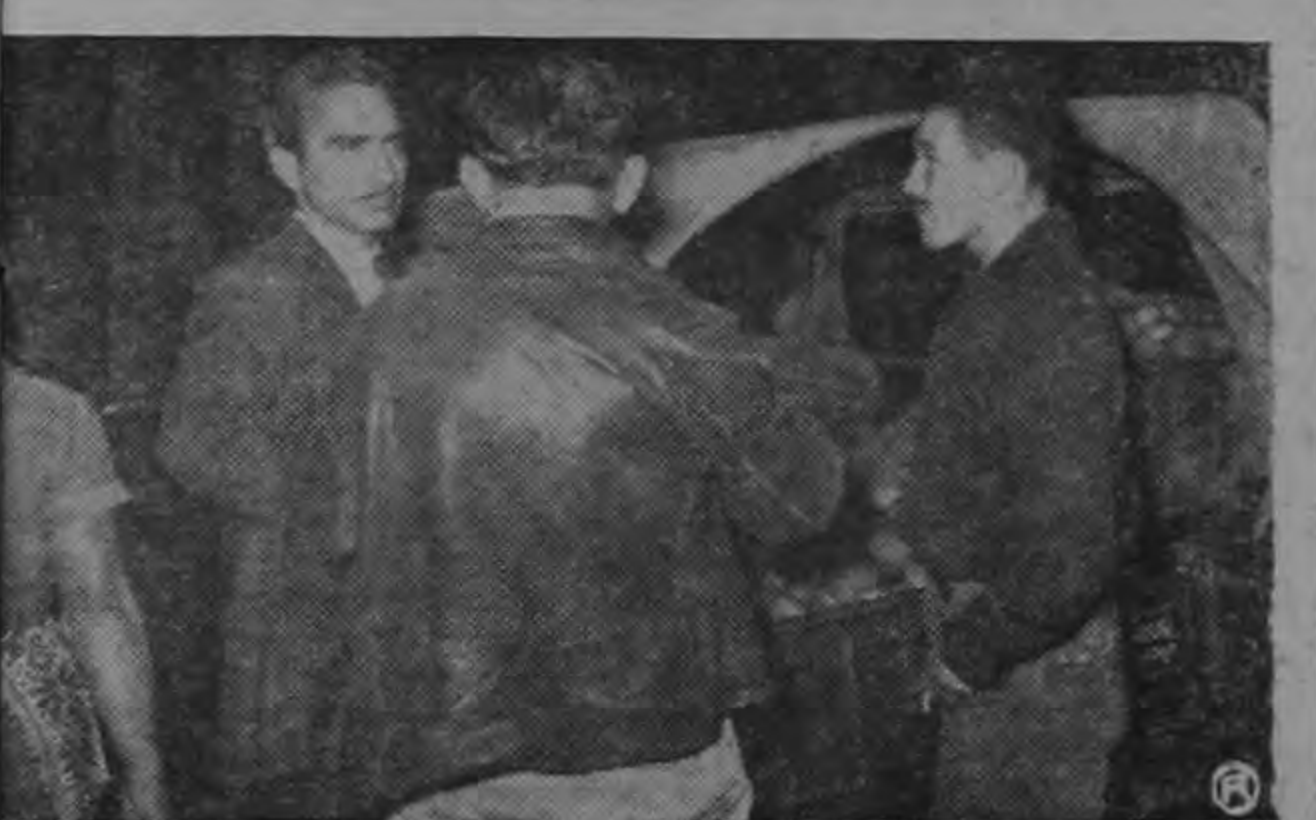
LA MEDIDA PUEDE SER BUENA O CONTRAPRODUCENTE: —Dice al redactor un intermediario refiriéndose a la medida tomada por el Gobierno para implantar precios máximos a las verduras, legumbres y frutas.—(Foto Solano).