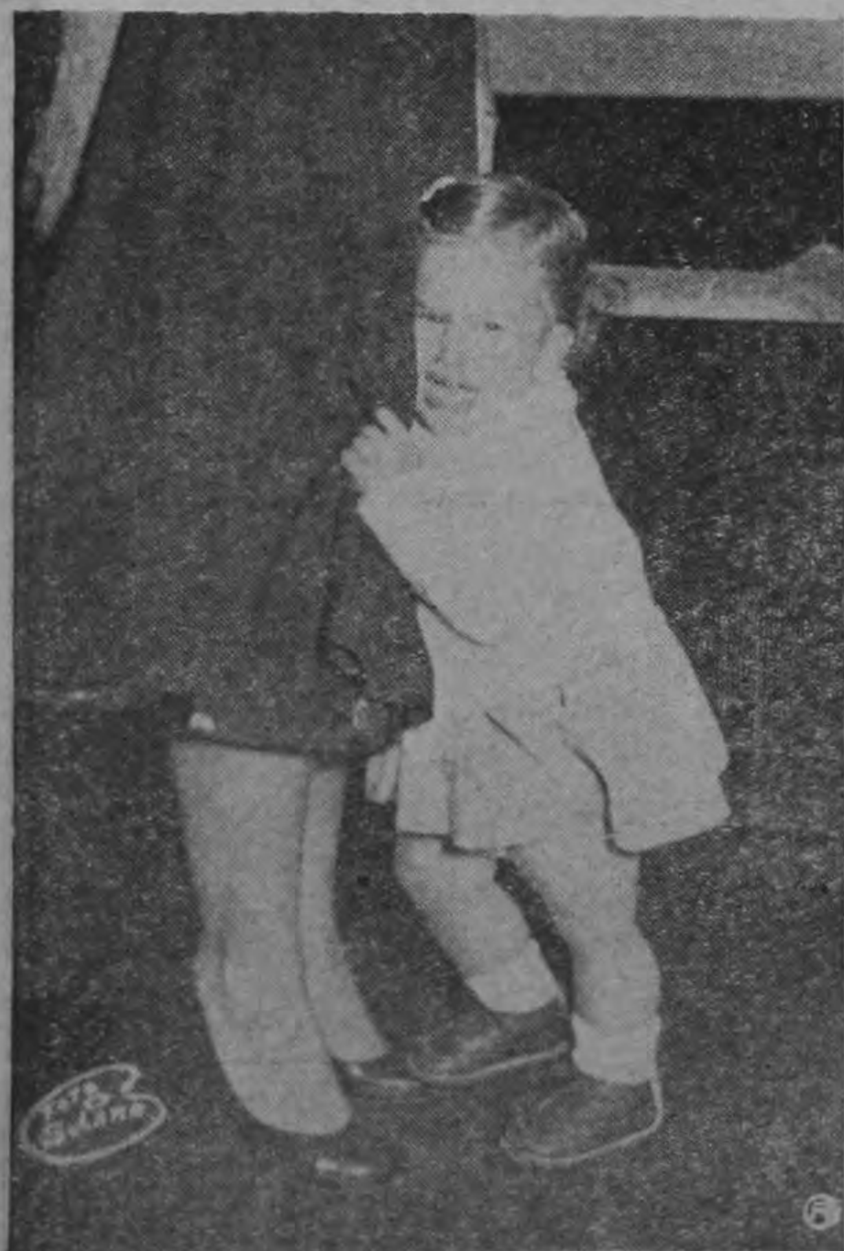
REFUGIO EN LOS TEMORES. —La Madre es el único refugio cierto y seguro en todos los temores.